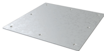
PLAQUE D'ATTENTE QC