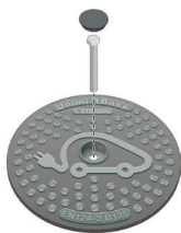
PLAQUE D'ATTENTE AC