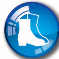
Chaussures de sécurité obligatoires