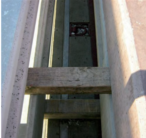
Calage intermédiaire impérativement à l'aplomb du calage de base.