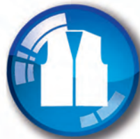
Gilet haute visibilité