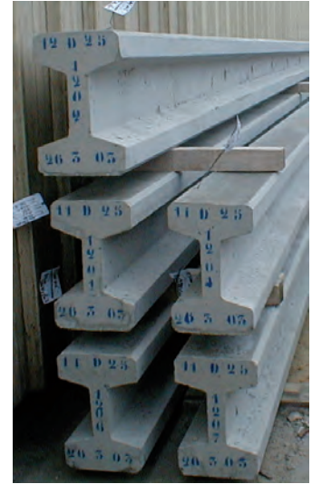
Stockage sur trois niveaux maxima, prévoir une stabilisation par groupe de deux ou trois piles.